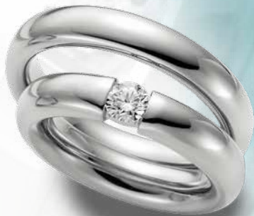
22 | BR 568 585 Weißgold