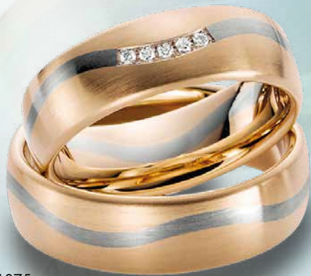
07 | 1075 585 Roségold mit Weißgold