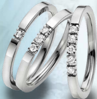
24 | 9777 - 1 25 | 9777 - 2 26 | 9777 - 3 585 Weißgold