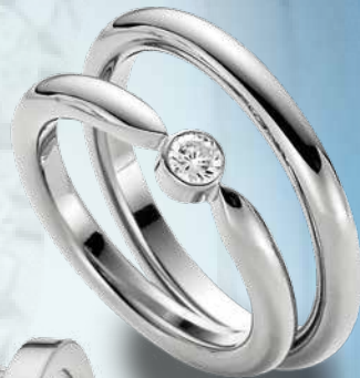
23 | BR 567 585 Weißgold