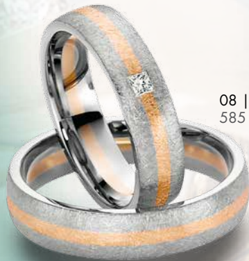
08 | 1074 585 Weißgold mit Roségold