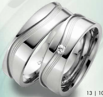
13 | 1066 585 Weißgold