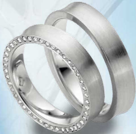
04 | 95175 Pt 950