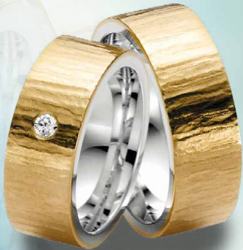
10 | 1069 585 Roségold auf Sterlingsilber