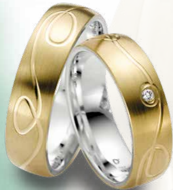
11 | 1072 585 Gelbgold auf Sterlingsilber