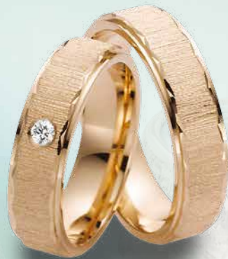
19 | 1077 585 Roségold