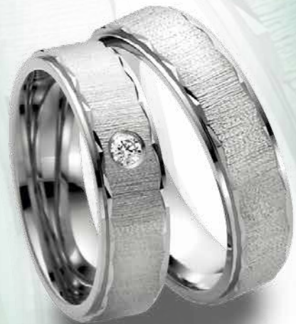
18 | 1076 585 Weißgold