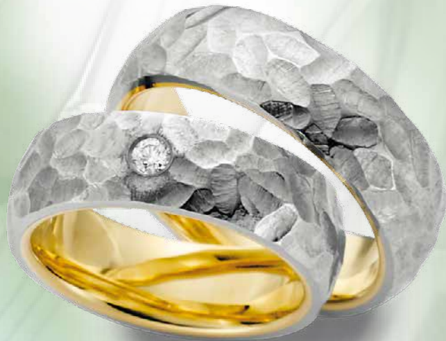
14 | 1039 750 Weißgold auf Gelbgold