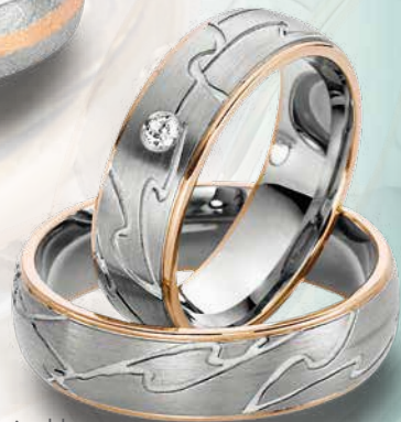
09 | 1067 585 Weißgold mit Roségold