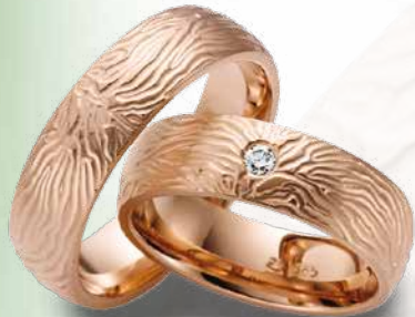
15 | 1079 585 Rotgold