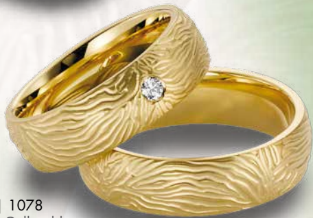
16 | 1078 585 Gelbgold