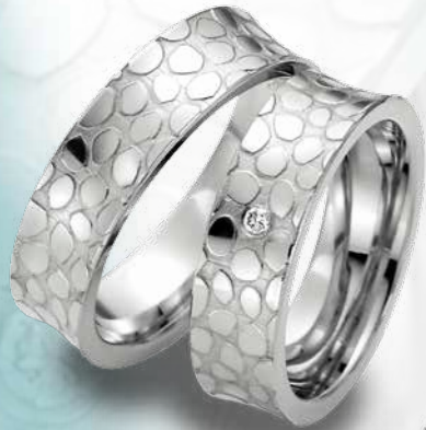
05 | 95174 Pt 950