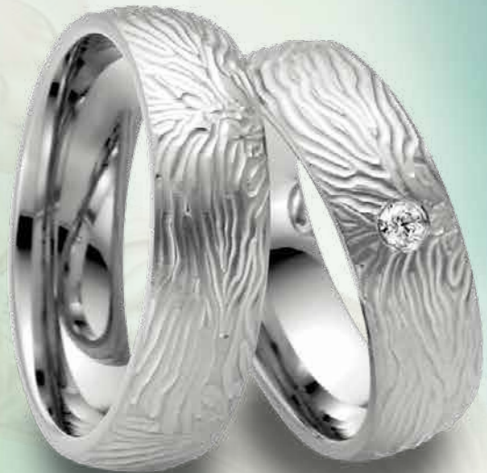
17 | 1080 585 Weißgold