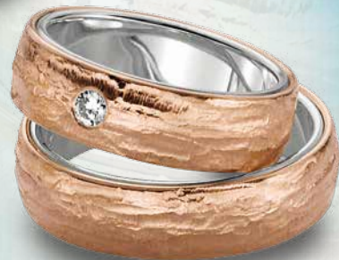
20 | 1070 585 Rotgold auf Sterlingsilber