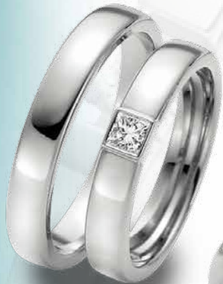
21 | BR 565 585 Weißgold