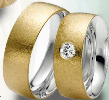
12 | 1071 585 Gelbgold auf Sterlingsilber