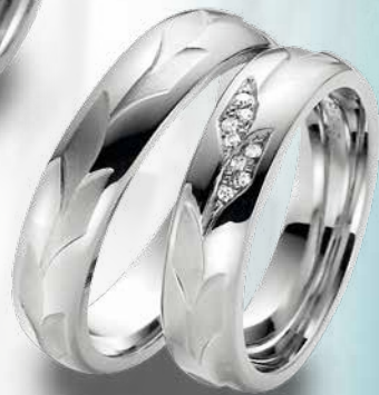
06 | 95184 Pt 950